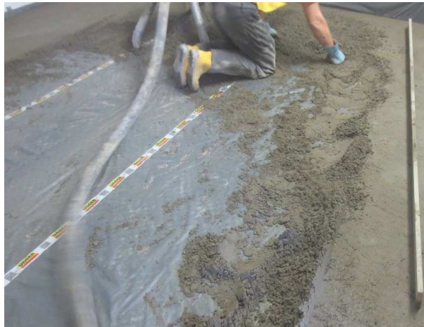
Abbildung A 2.2: Montagesituation mit Zementestrich