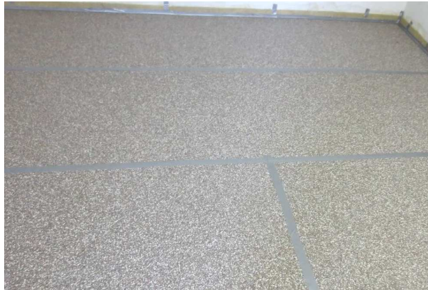
Abbildung A 2.1: Montagesituation mit Trittschalldämmmatten und Randdämmstreifen, Stöße mit Klebeband