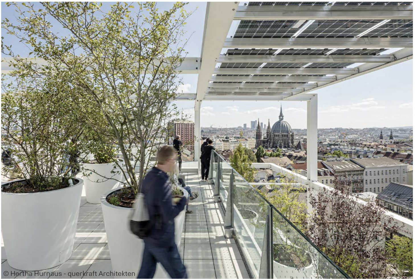
© Hertha Hurnaus - querkraft Architekten